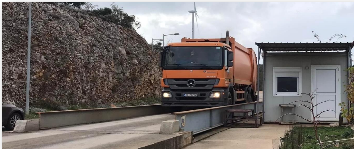
Slika 2. Elektronska vaga