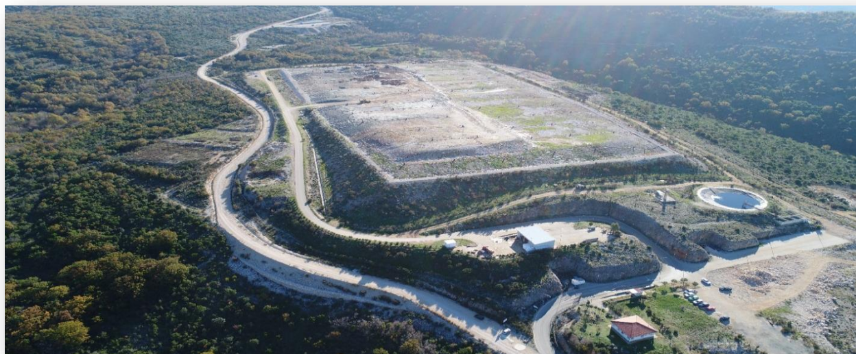
Slika 1. Deponija „Možura“

Nakon toga, u zakonom propisanoj precuduri, Agencija za zaštitu životne sredine je izdala, shodno Zakonu o integrisanom sprječavanju i kontroli zagađivanja životne sredine (“Sl. list RCG”,br. 80/05 od 28.12.2005. “Sl. list Crne Gore”, br. 54/09 od 10.08.2009. 40/11 od 08.08.2011) i Uredbom o vrstama aktivnosti i postrojenja za koje se izdaje integrisana dozvola (“Sl.list Crne Gore”, br. 07/08 od 01.02.2008.), produženje Integrisane dozvole za rad cjelokupnog postrojenja sanitarne deponije za čvrsti komunalni otpad i obavljanje aktivnosti odstranjivanja otpada dana 15.11.2023. god. Broj:03- UPI-701/6. Dozvola koja je izdata našem Društvu je druga koja je izdata u Crnoj Gori.