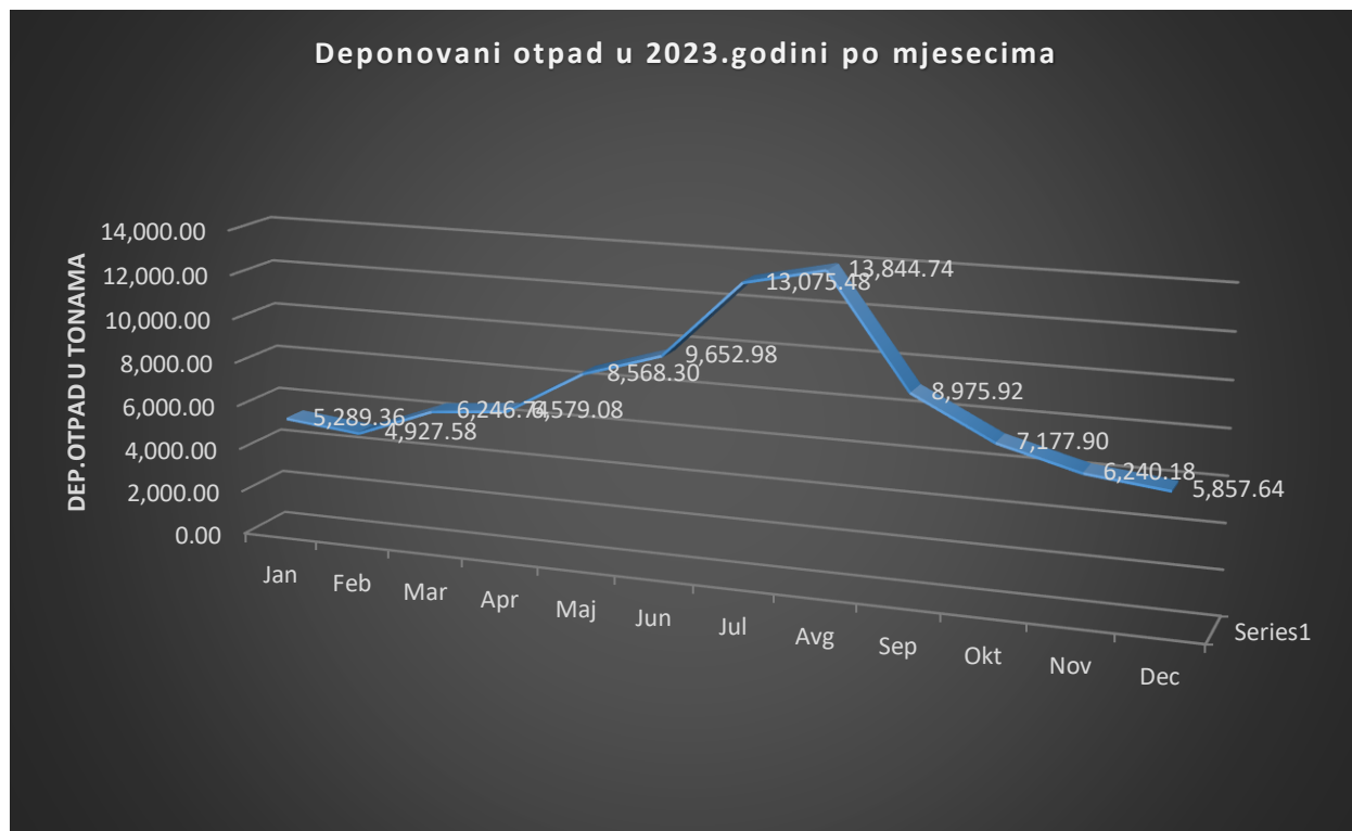
Grafikon 3. Prikaz količina deponovanog otpada

Na sledećem dijagramu su prikazane količine deponovanog otpada, gdje je najbolje prikazana sezonska neujednačenost količina otpada koje se odlažu na deponiji Možura.